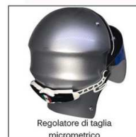
Regolatore di taglia micrometrico