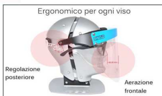
Ergonomico per ogni viso