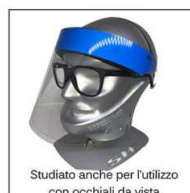
Studiato anche per l'utilizzo con occhiali da vista