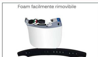
Foam facilmente rimovibile