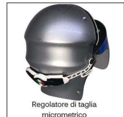
Regolatore di taglia micrometrico