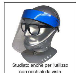
Studiato anche per l'utilizzo con occhiali da vista