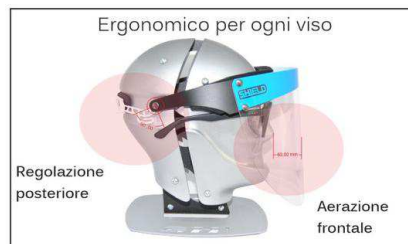
Ergonomico per ogni viso