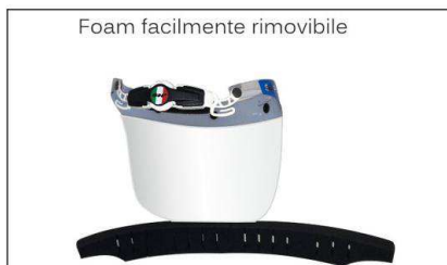
Foam facilmente rimovibile